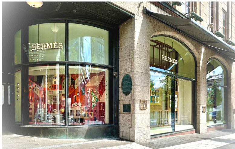
Keep the company AB Piteå, Sverige