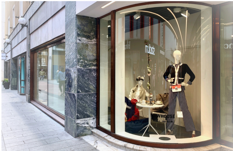
Keep the company AB Piteå, Sverige